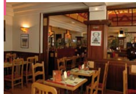
L'Instant Gourmand 81 rue du 20 e corps américain 03 87 56 52 17