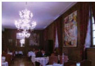
3 toiles de J.L. Trévisse sont exposées jusqu'au 30 octobre aux Amis de Saint-Louis