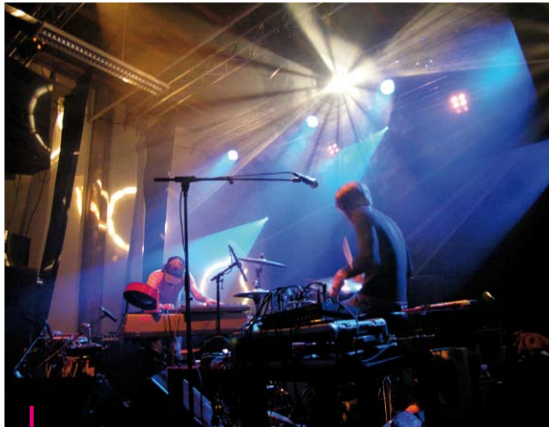
Les musiques électroniques seront au rendez-vous pour cette 13ème édition des Musiques Volantes.