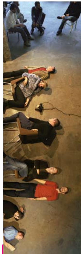
Debout sur le Zinc