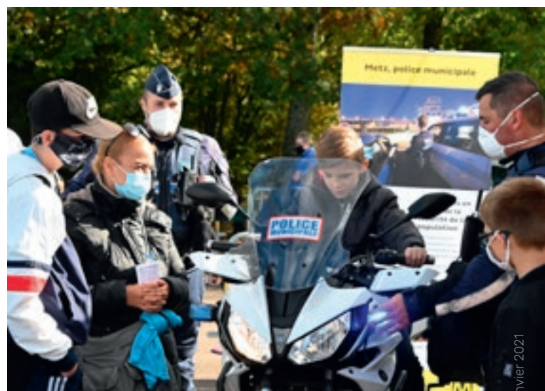
Prox'Aventure | En octobre dernier au city stade des Hauts de Vallières, l'opération Prox'Aventure a offert la possibilité d'une rencontre sportive et pédagogique entre forces de sécurité, pompiers et jeunes.