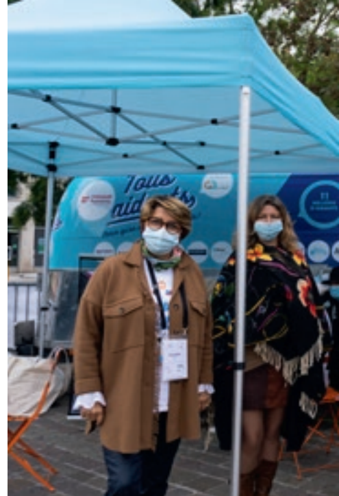
Étudiant dans ma Ville | L'édition 2020 s'est déroulée du 3 au 12 octobre avec en temps fort le village associatif, place d'Armes J.F. -Blondel.