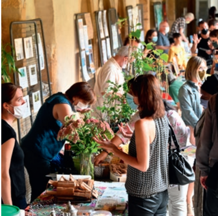
Fête de l'écologie | Au cloître des Récollets les 19 et 20 septembre derniers.