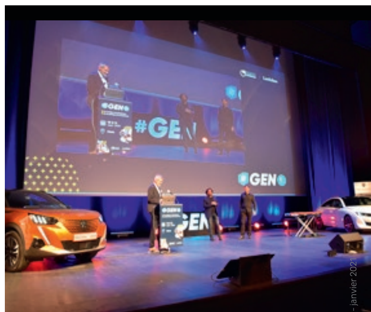
#GEN – 8 e édition | Le rendez-vous du business et du numérique du Grand Est s'est tenu au centre de congrès Robert Schuman les 10 et 11 octobre sur le thème de la transformation digitale des entreprises et du développement web.