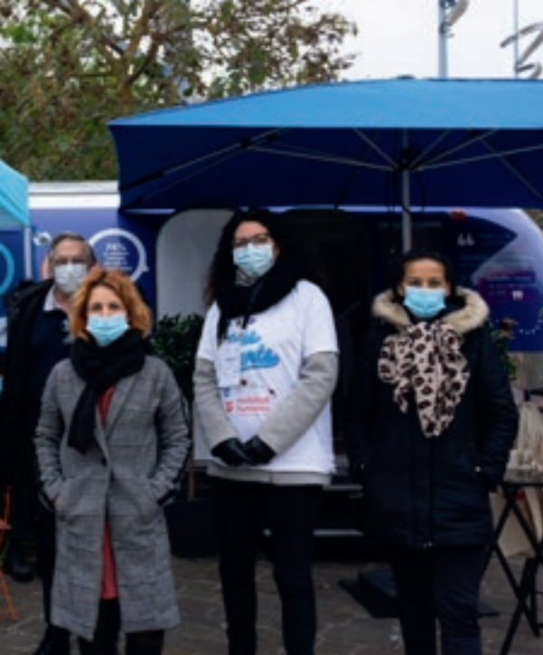
Tous Aidants | La caravane Tous Aidants de la Compagnie des Aidants s'est installée sur la place de la République afin d'accueillir, d'écouter et d'orienter les proches aidants souhaitant obtenir des informations.