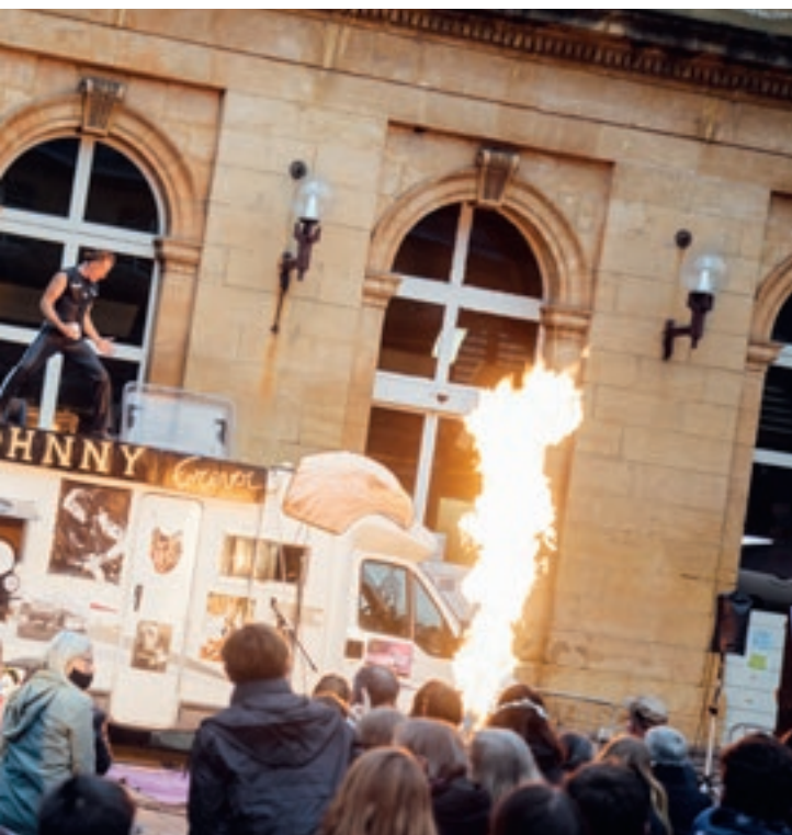
Festival Hop Hop Hop | Le festival international du spectacle à ciel ouvert est parti en tournée dans la métropole messine du 29 septembre au 4 octobre dernier