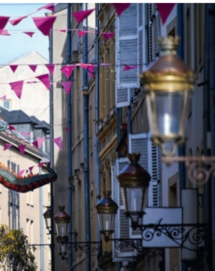
Octobre rose | Le mois international du dépistage du cancer du sein.