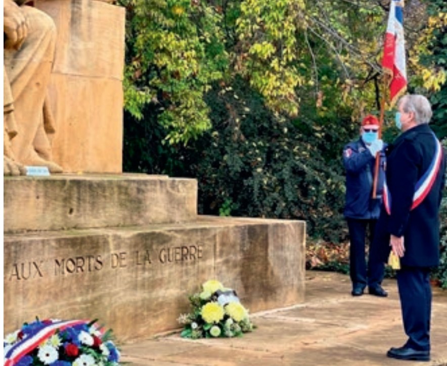
Cérémonie du 11 novembre | Le contexte sanitaire nous a contraints à organiser la cérémonie du 11 novembre 2020 en comité restreint. Rappelons-nous et honorons ceux qui ont sacrifié leur vie pour défendre la liberté.