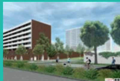
p.21 Cour du Languedoc