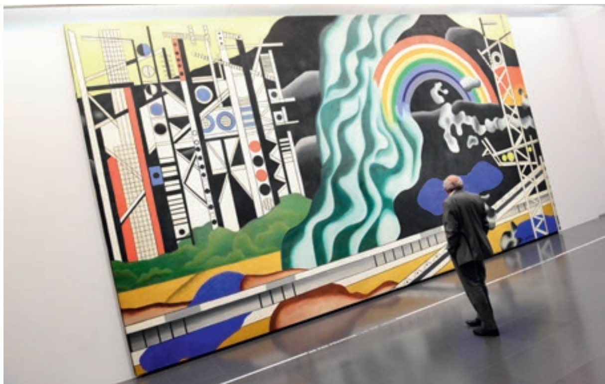
↑ Le Transport des forces , œuvre monumentale, comme un écho au label Art & Tech messin!